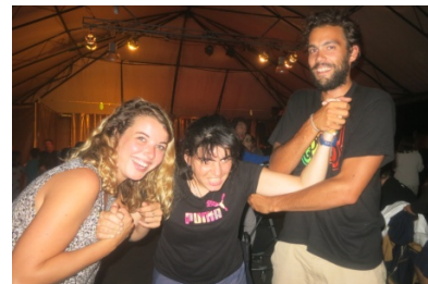
Sur la piste de danse tous les soirs

J'ai donc décidé de les observer méthodiquement sans révéler ma présence et de répertorier des variables, différences, similitudes, à partir des différents temps de la journée.