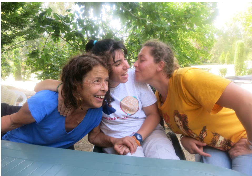
Tout le temps de la chaleur

J'ai mieux compris après l'avis de l'expert contacté, il a su identifier tout de suite le syndrome avec lequel j'ai été en contact, il préfère d'ailleurs l'appeler « qualité d'identification handicaponormée »