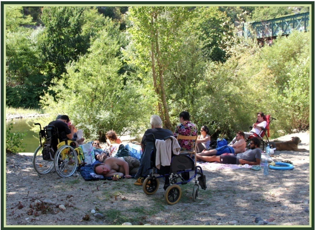
Farniente au bord de l'eau

Tous ensemble comme chaque année on s'est lancé et on a pris en charge pendant 15 jours 6 jeunes adultes handicapés!