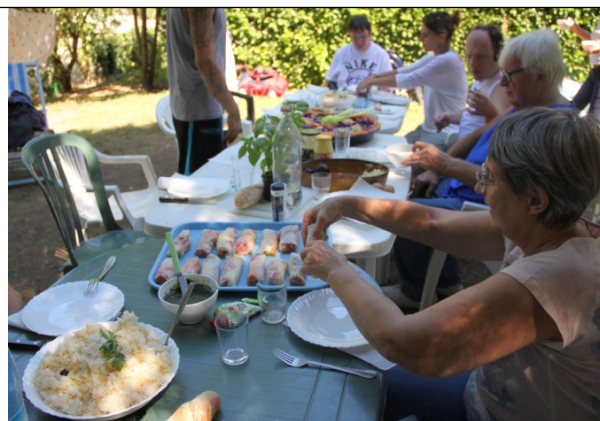
A table, on y joue, on y rit, on y mange

Bien sur Je sens poindre l'esprit « cartésien et fin limier » de certains lecteurs: ok la souffrance ou fragilité ou originalité mentale peut ne pas se voir même après étude approfondie, nous sommes beaucoup paraît il à le savoir mais il y avait quand même bien des personnes handicapées en fauteuil, des personnes qui avaient des difficultés motrices ça ça se voit ça se repère ?