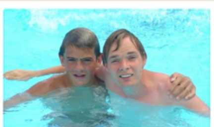
Camp 2007 - Méjannes le Clap