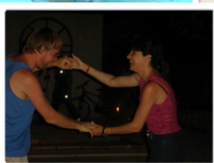
Camp 2008 - Méjannes le Clap