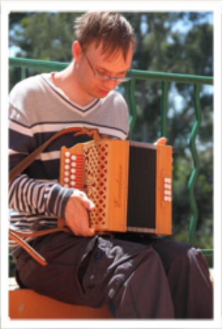
Course Algernon - 2013