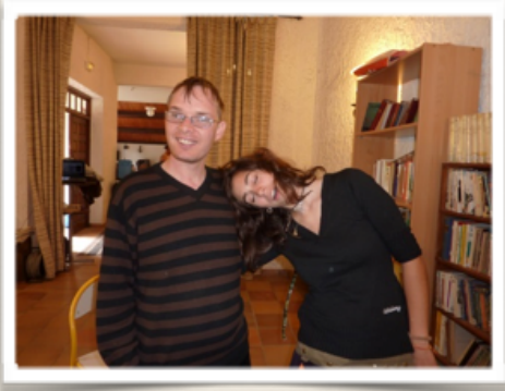
Fête à Jéré - 2013 - Massacan