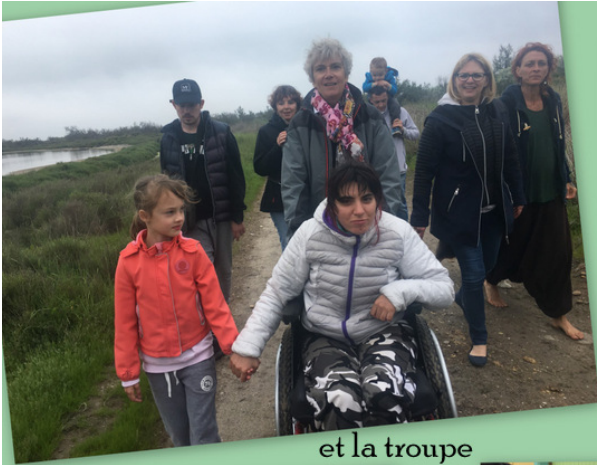
et la troupe